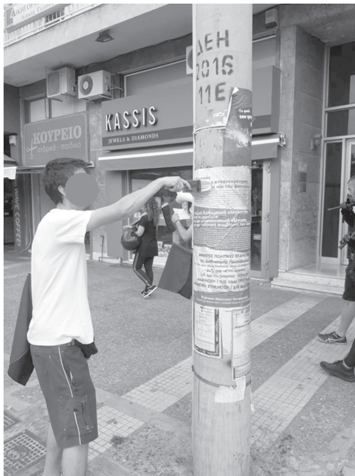
Αντιφασιστική Παρέμβαση στο Πέραμα το Σάββατο 26 Μαΐου

Εδώ και τουλάχιστον τρία χρόνια υπάρχει μια σταδιακή αλλά ποιοτική μεταστροφή του πολιτικού κλίματος. Η τρομοκρατία που προσπαθούσε να επιβάλλει η φασιστική συμμορία στο δήμο αυτό, συνεχώς περιορίζεται. Στους δρόμους υπάρχουν αντιφασιστικά συνθήματα ενώ έχουν πάψει οι κομματικές περιοδείες στα караβάκια και στη λαϊκή. Οι φασιστικές επιθέσεις το 2017 στα προσφυγόπουλα στο σχολείο στο Ικόνιο και στην αντιφασιστική συγκέντρωση της 20ης Σεπτεμβρίου αποτέλεσαν το κύκνειο άσμα της λειτουργίας των τοπικών γραφείων της Χρυσής Αυγής. Τα γραφεία του ναζιστικού σωματείου του «Αγ. Νικολάου» σηκώνουν, πλέον, το βάρος του οργανωτικού κέντρου των φασιστών.