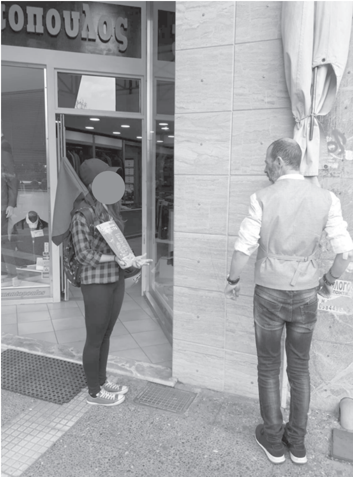
Αντιφασιστική Παρέμβαση στο Πέραμα το Σάββατο 26 Μαΐου

επί τρεις μέρες μαζική παρουσία αντιφασιστών έξω από τα Δικαστήρια Πειραιά μην επιτρέποντας τους δεκάδες φασίστες να προπηλακίσουν τους συντρόφους μας.