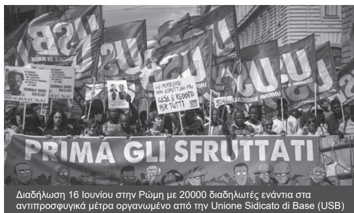
Διαδήλωση 16 Ιουνίου στην Ρώμη με 20000 διαδηλωτές ενάντια στα αντιπροσφυγικά μέτρα οργανωμένο από την Unione Sidicato di Base (USB)

Αρχές Ιουνίου ορκίστηκε η νέα κυβέρνηση συνασπισμού μεταξύ του Κινήματος των 5 Αστέρων (K5A) και της Λίγκας του Βορρά σε μία από τις μακροχρόνιες προσπάθειες μετά από αυτή της κυβέρνησης Αμάτο το 1992. Οι νέοι παίκτες στο ιταλικό πολιτικό σκηνικό, από την μία πλευρά το πολυσυλλεκτικό λαϊκίστικο K5A που εύκολα μετατοπίστηκε σε ακόμα πιο δεξιές κατευθύνσεις και από την άλλη η ανοικτά ακροδεξιά και ρατσιστική Λίγκα προκρίθηκαν να σχηματίσουν κυβέρνηση παραμερίζοντας το Δημοκρατικό Κόμμα και τον